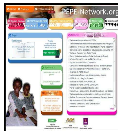
Reorganização e atualização do Site do PEPE NETWORK.